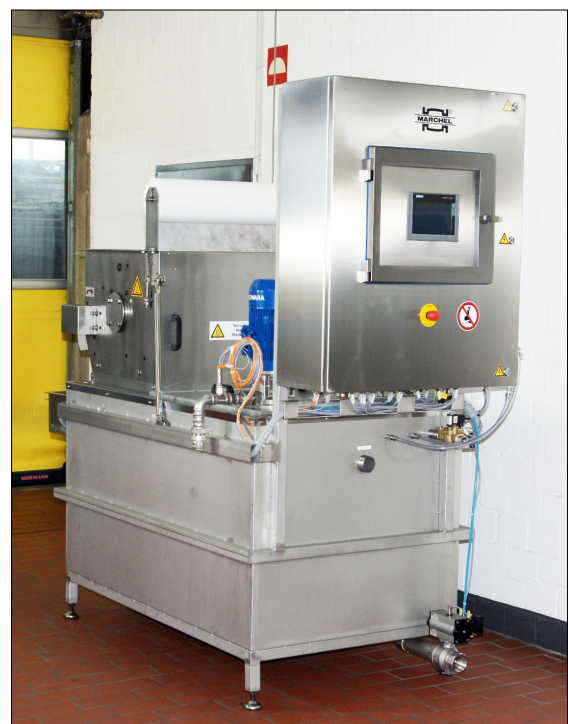
Ansicht einer Filtereinheit mit 550 Litern Brauchwasservolumen